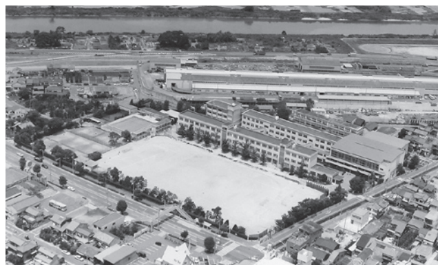
1992 (H4) 東の川が暗渠になった。正門が東に。

同窓会は「楽しくなければ同窓会ではない」を合言葉に、今後も様々な楽しい企画を考えていきたいと思えます。みなさまのご参加をお待ちしています。詳しくはHPをご覧ください。