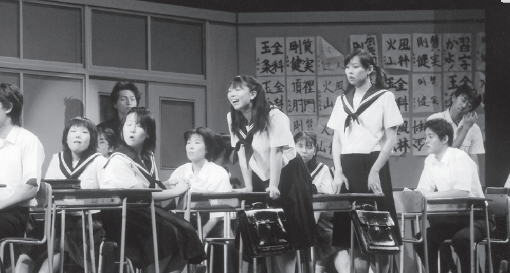
大好評だった記念行事「わが故郷は平野金物店-夢さえあれば」