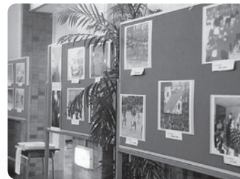
式典イベント部の写真展